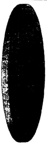
Evolução Patrimonial no ano